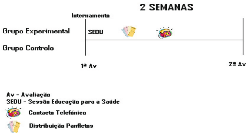
FIGURA 1 – Desenho de Investigação

Neste sentido, as hipóteses de investigação foram as seguintes: H1: A aplicação do programa de informação estruturada reduz o nível de ansiedade na família de um utente internado pela primeira vez em Psiquiatria; H2: Existem diferenças estatísticas significativas entre os grupos de controlo e experimental no que diz respeito ao nível de ansiedade, entre os diferentes momentos de avaliação.