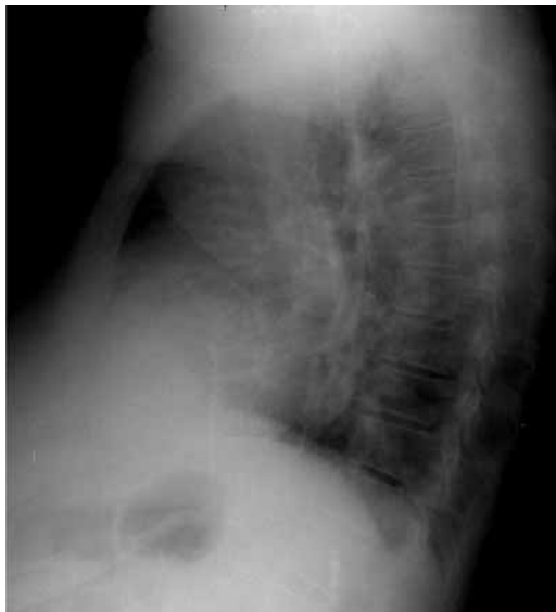
Fig. 2 – Telerradiografia do tórax perfil direito (06-04-2006). Alargamento do mediastino superior

no decúbito. Estas queixas levaram ao diagnóstico de asma brônquica, e a doente encontrava-se medicada com broncodilatores e corticosteróides inalados sem se verificar benefício sintomático.