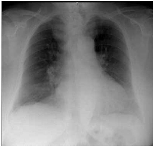
Fig. 1 – Telerradiografia do tórax PA (06-04-2006). Alargamento do mediastino superior e desvio para a esquerda da coluna de ar traqueal

No caso apresentado pelos autores, a doente referia sintomas que se relacionavam com o bócio mergulhante: dispneia; tosse e desconforto cervical anterior, com acentuação