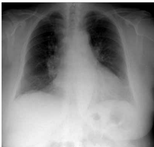
Fig. 4 – Telerradiografia do tórax PA após tireoidectomia parcial (11-07-2006). Coluna de ar traqueal centrada e sem desvios. Não se observa alargamento do mediastino superior

mas só em alguns casos pode observar-se um desvio nítido da traqueia 3 .