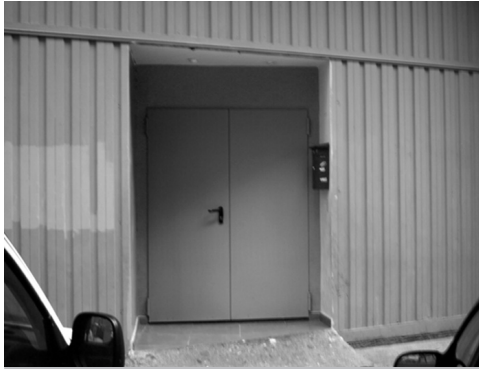
Figura 2 – Local de culto da Igreja Filadélfia, Madrid.