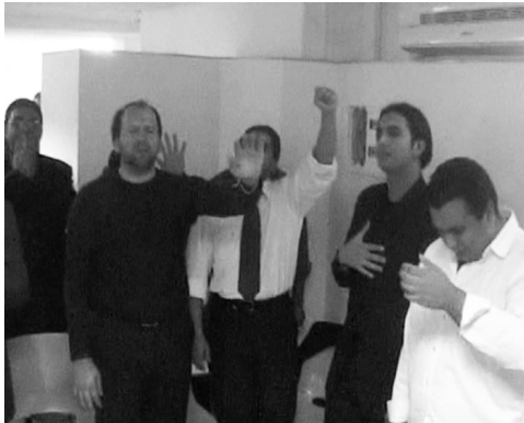
Figura 3 – Oração.