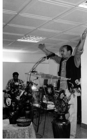
Figura 4 – Pregação.

nos contextos pentecostais carismáticos é traduzido nos distintos dons que se acredita serem atribuídos na experiência do Espírito Santo. 7 No entanto, talvez a expressão émica que melhor defina a experiência do contacto e o objectivo último do culto seja a de shekinah , ou seja, a “presença de Deus”. Shekinah , de origem hebraica, é frequentemente referida por crentes e oradores como algo que se cultiva através do culto, uma manifestação ou revelação (“contacto”) propiciada pela adoração, que produz a “irradiação,” a “glória de Deus”. 8